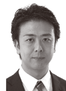
福岡市長 高島宗一郎